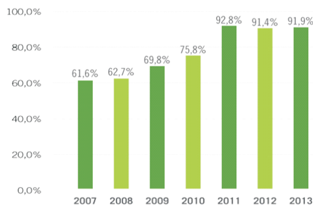
Figura 2 Mejoramiento pruebas de Estado – Grado 11 - Instituciones Educativas vinculadas al Programa Líderes Siglo XXI

Así pues, después de veinte años se ha logrado evidenciar en las instituciones beneficiarias el mejoramiento de los principales indicadores del desempeño escolar, tales como: examen de Estado de la educación media, la retención de estudiantes, la matrícula, la ubicación de los egresados en la educación superior y el mundo laboral y la satisfacción de los miembros de la comunidad con el servicio prestado. Estos resultados le dan solidez a la propuesta y motivan la continuidad y el fortalecimiento del proyecto, convocando cada día con mayor efectividad a líderes empresariales y gubernamentales que posibiliten el alcance de la misión (Fundación Nutresa, 2014).